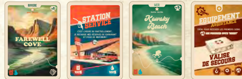
Rivière de 4 cartes